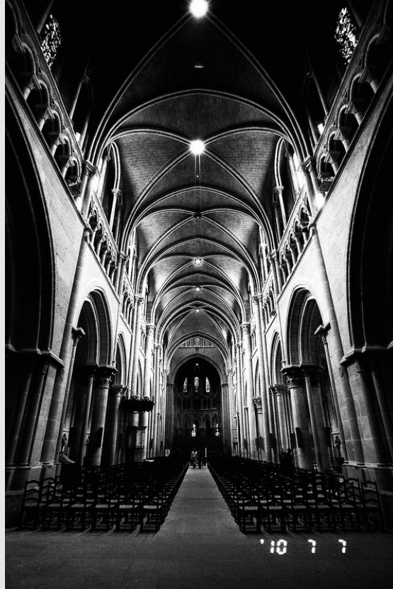
Notre-Dame de Lausanne (CC BY 2.0) Ghost in the Shell 2010